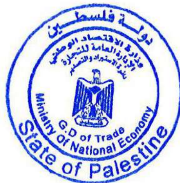
وزارة الاقتصاد إدارة الاستيراد والتصدير