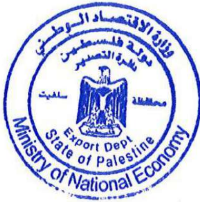
وزارة الاقتصاد محافظة سلفيت