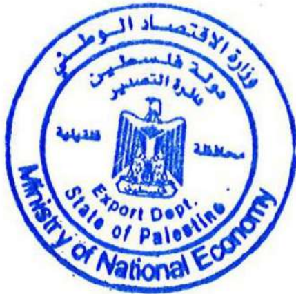
وزارة الاقتصاد محافظة قلقيلية