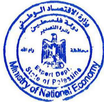
وزارة الاقتصاد محافظة رام الله